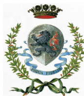
Comune di Brescia