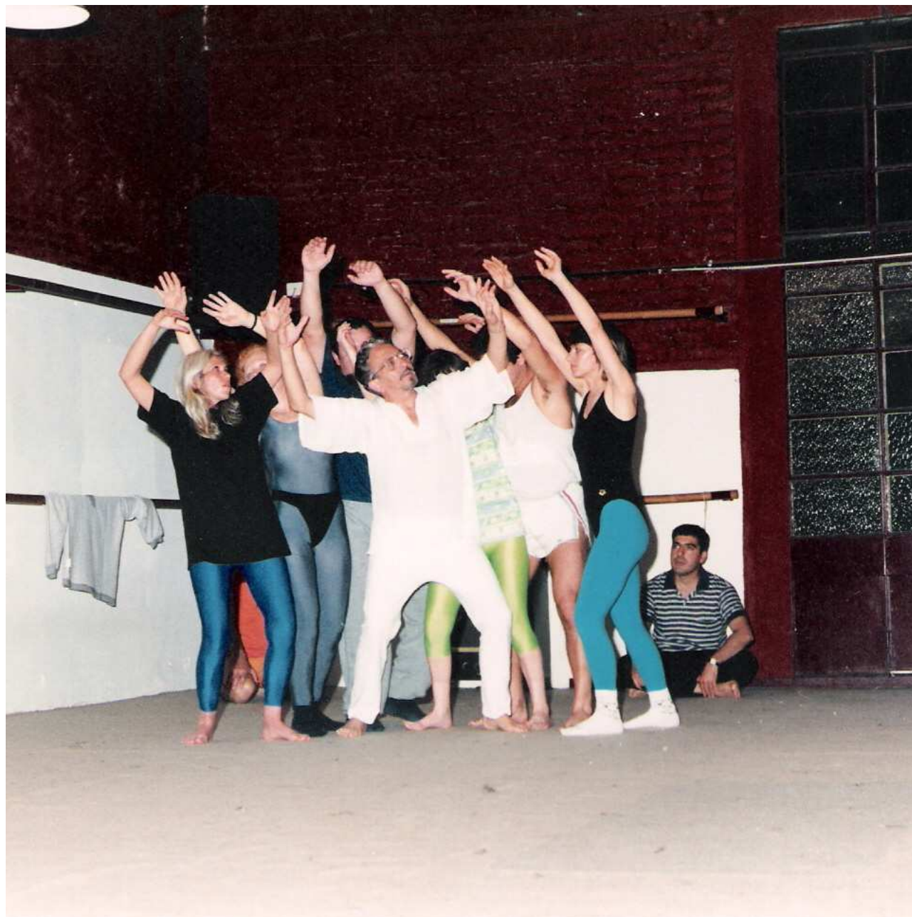
Coreografia tematica: “La Natura - Alberi mossi dal vento”